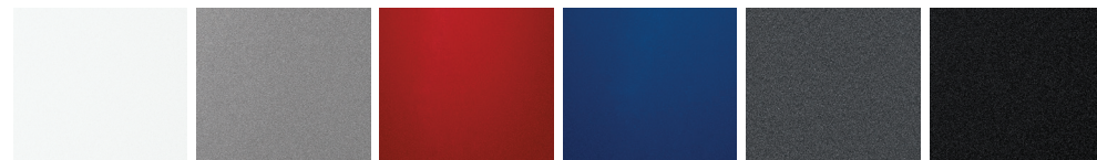
Blanco Plata Rojo Azul Gris Negro